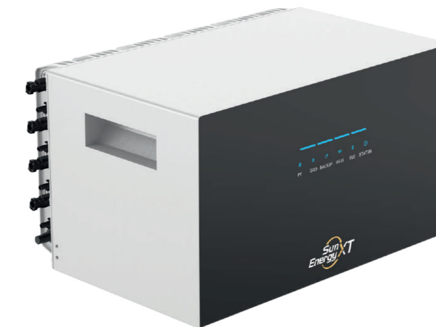
SunEnergy XT 500 1649,00 EUR

5 kWh Stromspeicher mit 2400 W Ausgangsleistung 4 x PV Eingänge für bis zu 8 Module Mit intelligentem Energiemanagement Notstromfähig und erweiterbar