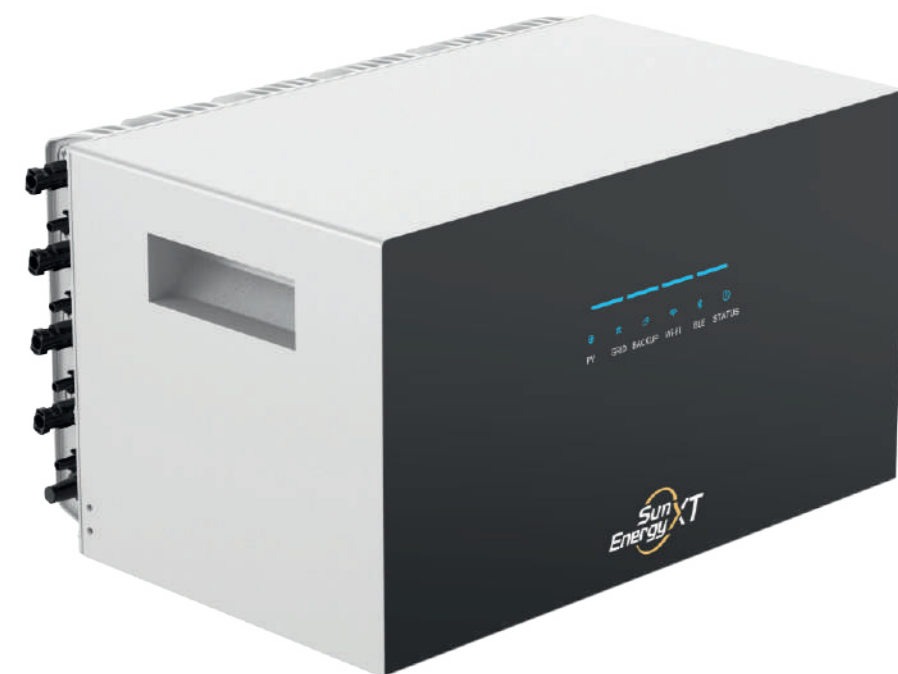
SunEnergy XT 500 Pro 1699,00 EUR

2,15 kWh Erweiterungsakku 1 x PV Eingang für bis zu 2 Module Passend für SunEnergy XT BK215 Einfache Systemerweiterung Robuste LiFePO4-Technologie