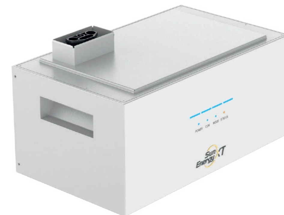
SunEnergy XT B500 1150,00 EUR

5 kWh Stromspeicher mit 800 W Ausgangsleistung 4 x PV Eingänge für bis zu 8 Module Optimierung des Eigenverbrauchs Einfache Plug-and-Play-Integration