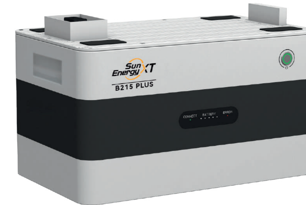
SunEnergy XT B215 749,00 EUR

2,15 kWh Stromspeicher 2 x PV Eingänge für bis zu 4 Module Erweiterbar auf höhere Kapazitäten mit dem XT B215 kompatibel mit ausgewählten Wechselrichtern zwischen 800 W und 2000 W Ausgangsleistung