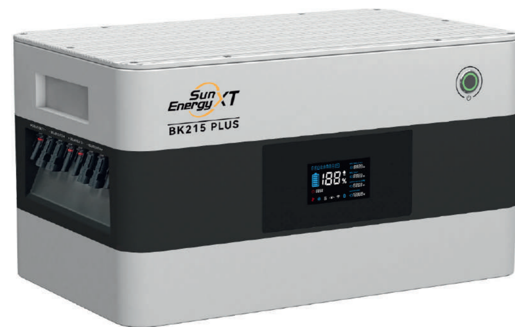
SunEnergy XT BK215 Plus 799,00 EUR

2,15 kWh Stromspeicher 2 x PV Eingänge für bis zu 4 Module Erweiterbar auf höhere Kapazitäten mit dem XT B215 kompatibel mit ausgewählten Wechselrichtern zwischen 800 W und 2000 W Ausgangsleistung